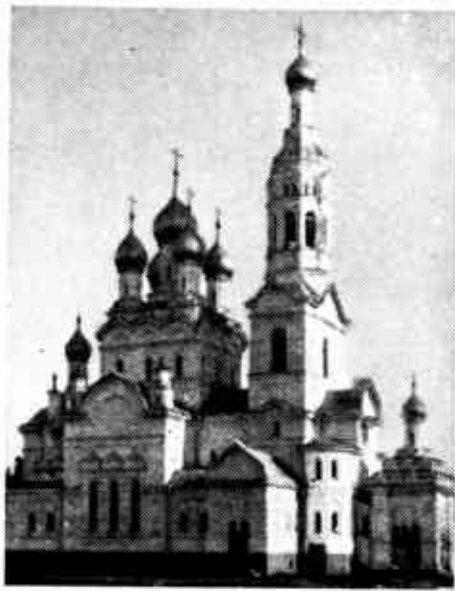
Terijoen venäläinen kirkko.