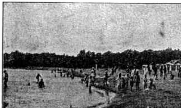
Merellä ja hiekan lumoissa.