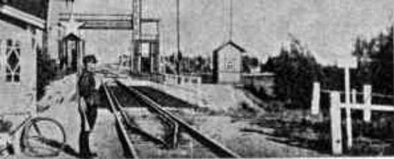
Lännen ja idän raja.

metsiköt rehevine kasvullisuuksineen ja rauhallisine metsäpolkuineen tarjoavat oivallisia retkeilykohteita. Ja niin »merenhengessä» kuin Terijoki eläekin, ei puutu myöskään sisämaan runollisen kauniita järviäkään, sillä niitäkin on vieraan varaksi.