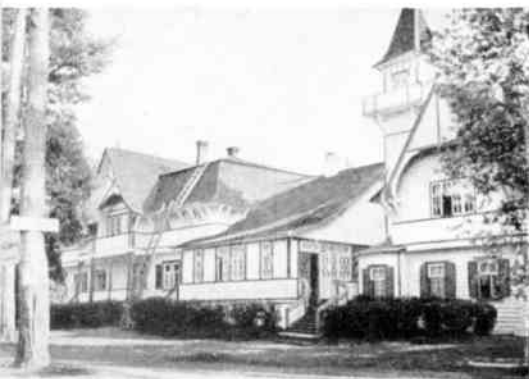
Terijoen Merikylpylän Kasino